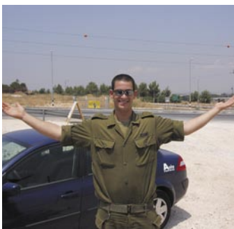
עידו ז"ל בתנוחה אופיינית

כאן, במטע הזיתים, חייו, חיי משפחתו, חבריו ומעגלי משפחת הנשמה הרחבה-